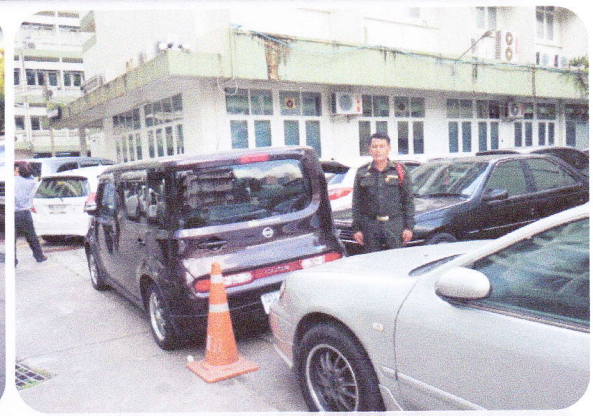
การจัดเวรยามรักษาความปลอดภัย