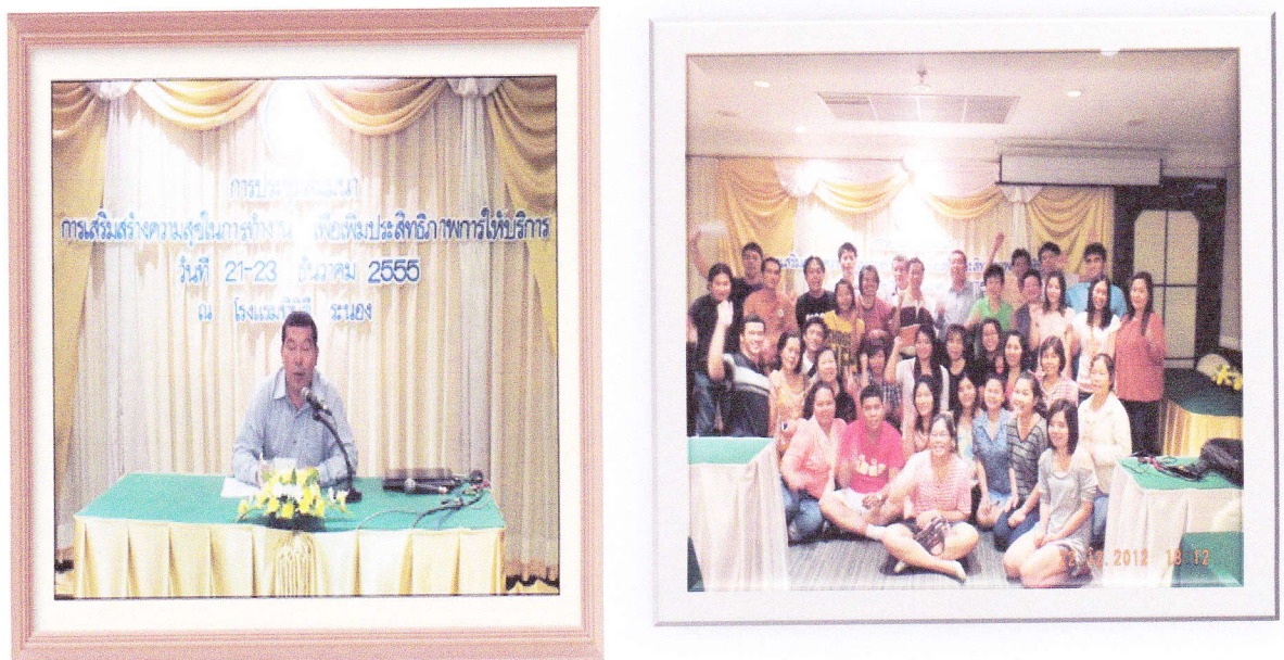
๔.๔ กิจกรรมคุณภาพชีวิต