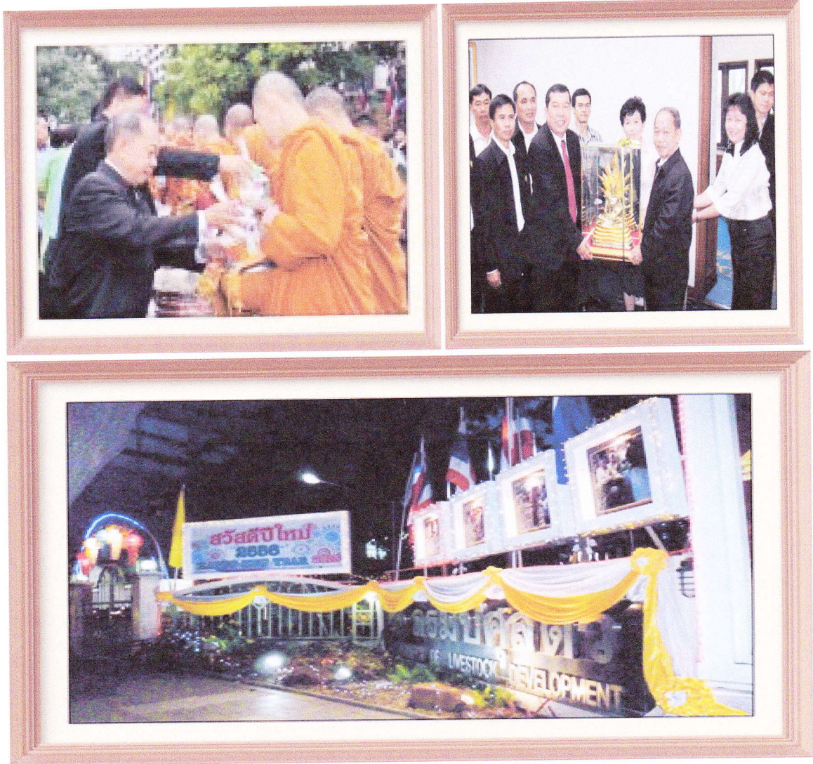
๔.๓ กิจกรรมนันทนาการ