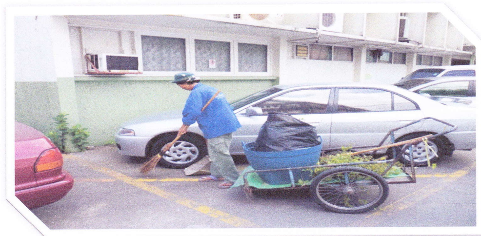
กิจกรรมการทำความสะอาดประจำวัน