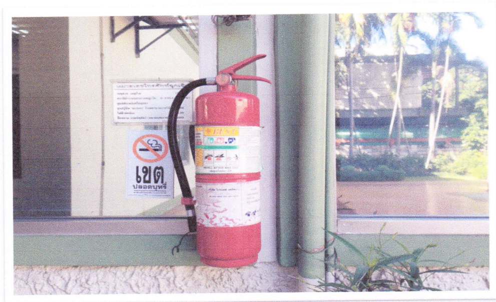
ติดตั้งถังดับเพลิง