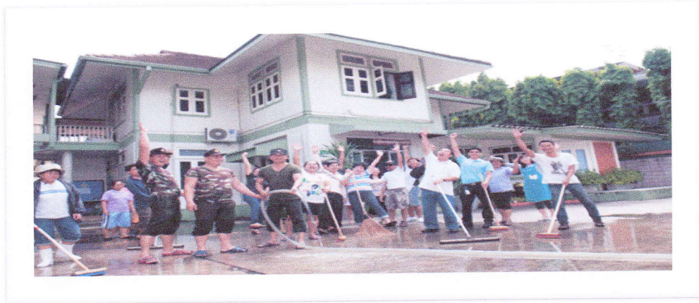
กิจกรรม Big Cleaning Day